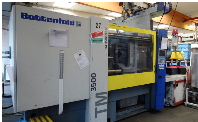
Pos. 62 1 Kunststoffspritzgießmaschine 1 Injection molding machine