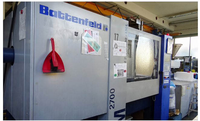
Pos. 14 1 Mehrkomponenten Kunststoffspritzgießmaschine 1 Multi-component injection molding machine