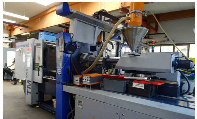
Pos. 61 1 Kunststoffspritzgießmaschine 1 Injection molding machine