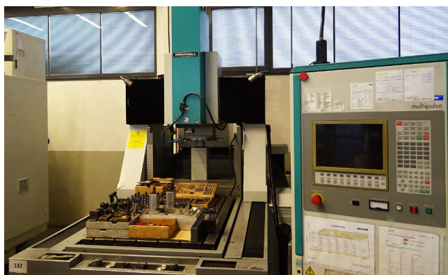
Pos. 132 1 Senkerodiermaschine 1 Vertical eroding machine