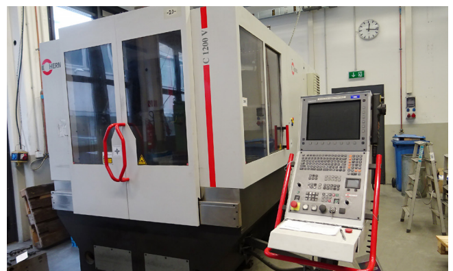
Pos. 188 1 CNC Fräsmaschine 1 CNC Milling machine