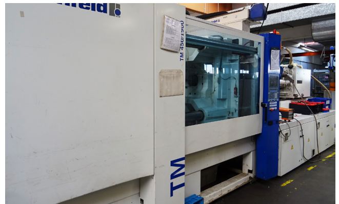
Pos. 63 1 Kunststoffspritzgießmaschine 1 Injection molding machine