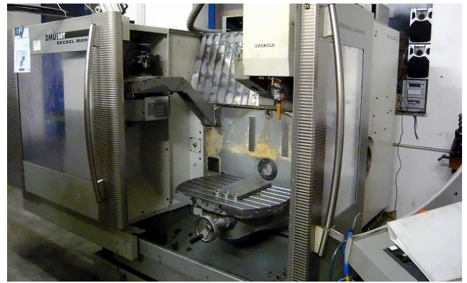
Pos. 5 1 CNC-Universal-Bohr- und Fräsmaschine 1 CNC Universal drilling/milling machine