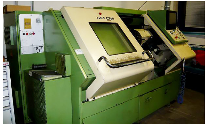
Pos. 20 1 CNC-Schrägbett Drehmaschine 1 CNC Slant-bed lathe