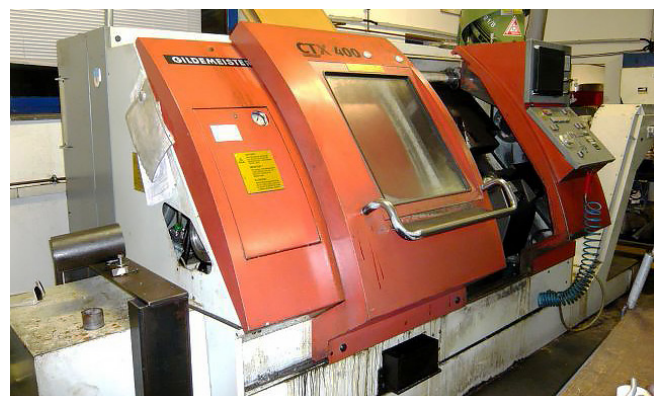
Pos. 21 1 CNC-Schrägbett Drehmaschine 1 CNC Slant-bed lathe