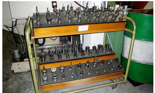
Pos. 18 1 WTS-Wagen 1 WTS trolley