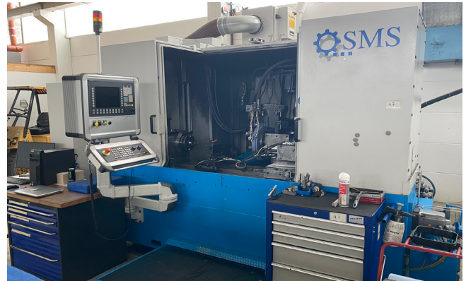
Pos. 47 1 CNC-Schnecken-/ Rotorschleifmaschine SMS HNC355-CNC 1 CNC Worm and rotor grinding machine SMS HNC355-CNC, YOM 2015