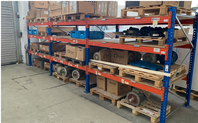
Pos. 10 1 Posten Palettenregalanlagen 1 lot of Pallet racking systems