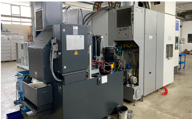
Pos. 29 15-Achs-Bearbeitungszentrum HELLER FP4000, Bj. 2011 15-axis machining center HELLER FP4000, YOM 2011