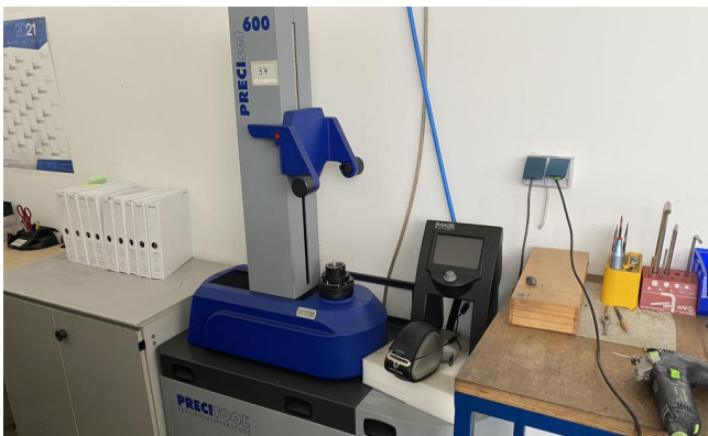
Pos. 37 1 Werkzeugvoreinstellgerät PRECITOOL PRECISET 600, Bj. 2015 1 Tool presetter PRECITOOL PRECISET 600, YOM 2015