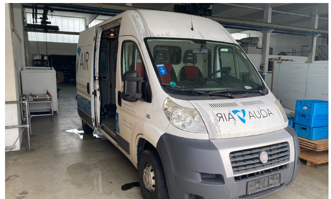
Pos. 132 1 Transporter FIAT DUCATO, Diesel, EURO 5, 109 kW, EZ 07/2012 1 Van FIAT DUCATO, Diesel, EURO 5, 109 kW, initial reg. 07/2012