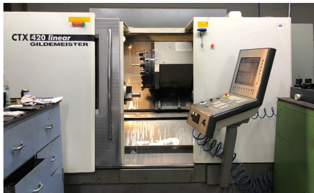
Pos. 46 1 CNC-Dreh- und Fräsmaschine GILDEMEISTER CTX 420 LINEAR V4 1 CNC lathe and milling machine GILDEMEISTER CTX 420 LINEAR V4, YOM 2003