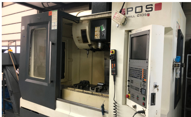
Pos. 32 1 CNC-Bearbeitungszentrum POS MILL C 1050, Bj. 2010 1 CNC machining center POS MILL C 1050, YOM 2010