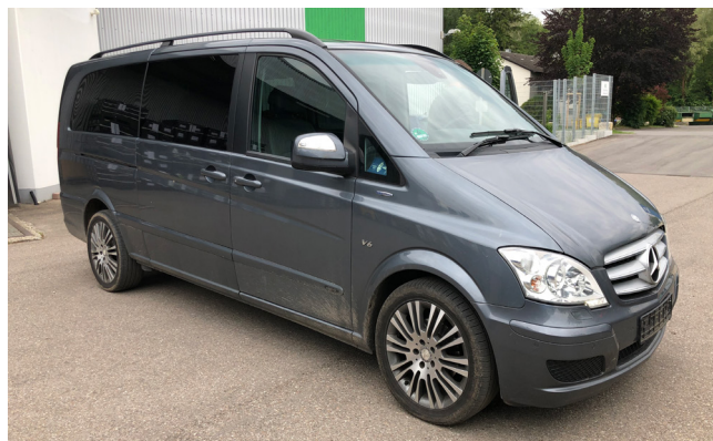
Pos. 103 1 PKW MERCEDES BENZ VIANO AMBIENTE EDITION CDI 3,0, EZ 7/2012 1 Car MERCEDES BENZ VIANO AMBIENTE EDITION CDI 3,0, first reg. 07/2012