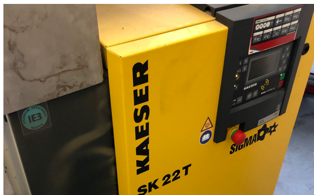
Pos. 57 1 Schraubenkompressor KAESER SK22T, Bj. 2017 1 Screw compressor KAESER SK22T, YOM 2017