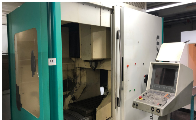
Pos. 41 1 Bearbeitungszentrum DMG DMC70V HI-DYN, Bj. 2000 1 Machining center DMG DMC70V HI-DYN, YOM 2000