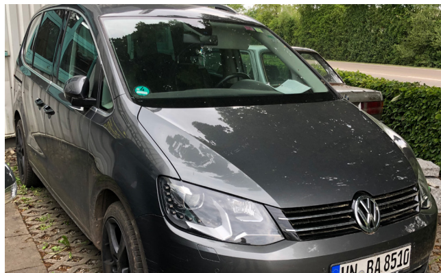
Pos. 106 1 PKW VOLKSWAGEN SHARAN 2.0 TDI HIGHLINE DSG EZ 05/2013 1 Car VOLKSWAGEN SHARAN 2.0 TDI HIGHLINE DSG first reg. 05/2013