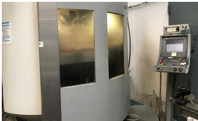
Pos. 18 1 CNC-Bearbeitungszentrum DECKEL MAHO DMU100T, Bj. 2000 1 CNC machining center DECKEL MAHO DMU100T, YOM 2000