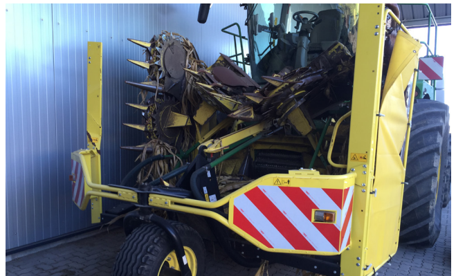
Pos. 203 1 Maisgebiss Kemper 375 Plus, Bj. 2016 1 Corn header Kemper 375 Plus, manufactured in 2016