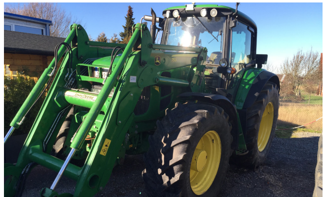
Pos. 201 1 Allradschlepper John Deere 6930 Premium, Bj. 2011 14WD Tractor John Deere 6930 Premium, manufactured in 2011