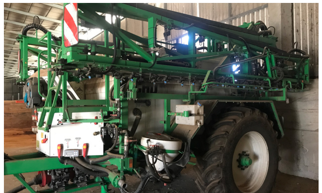
Pos. 219 1 Feldspritze CHD Eefting F3027, Bj. 2014 1 Field sprayer CHD Eefting F3027, manufactured in 2014