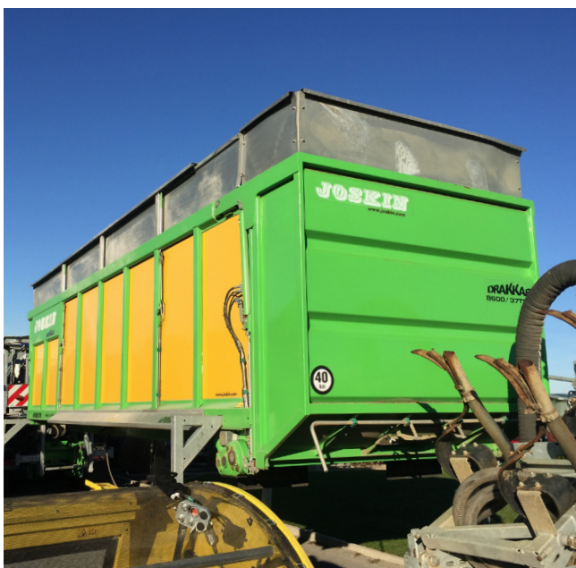
Pos. 205 1 Wechselfahrgestell Joskin Cargo TRM 750, Bj. 2015 1 Alternating chassis Joskin Cargo TRM 750, manufactured in 2015