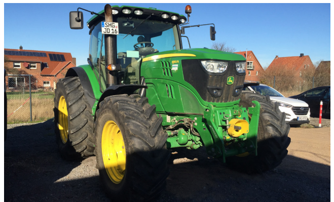
Pos. 200 1 Allradschlepper John Deere 6150R, Bj. 2014 14WD Tractor John Deere 6150R, manufactured in 2014