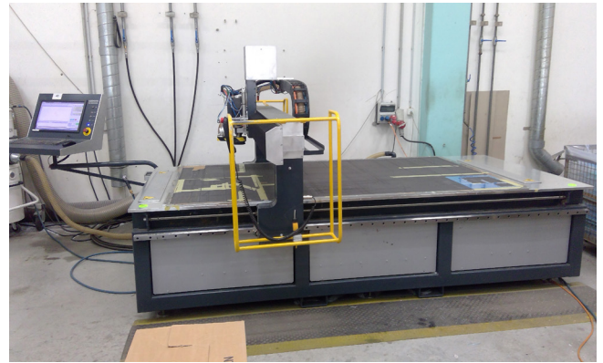
Pos. 43 1 HSC-Portalfräsmaschine Harmuth Profi 2500, Bj. 2016 1 HSC Portal milling machine Harmuth Profi 2500, manufactured in 2016