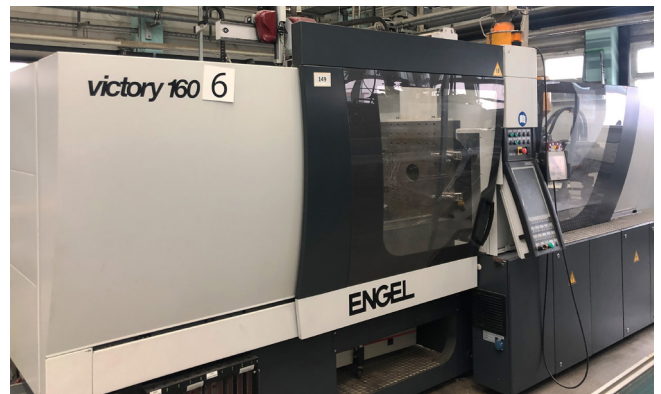
Pos. 149 1 Kunststoffspritzgießmaschine Engel Victory 1050/160 tech, Bj. 2012 1 Plastic injection moulding machine Engel Victory 1050/160 tech, man. 2012