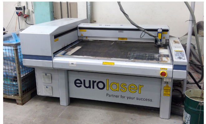
Pos. 44 1 CNC-Laserschneidanlage Eurolaser M-800, Bj. 2013 1 CNC Laser cutting system Eurolaser M-800, manufactured in 2013