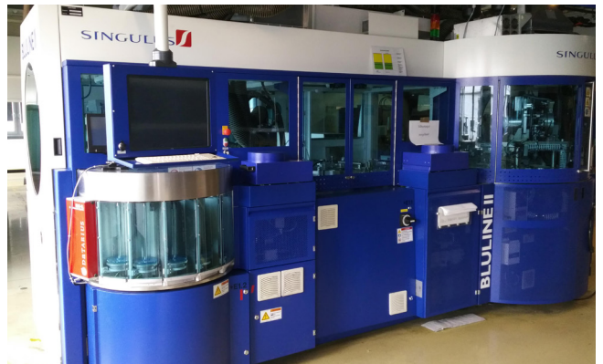
Pos. 256 1 BD Linie 8 1 BD Line 8