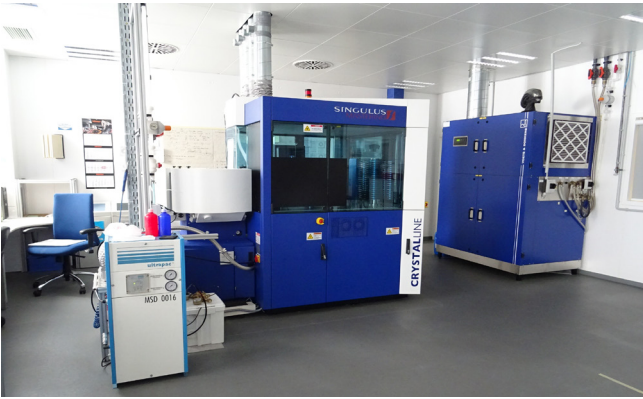
Pos. 21 1 Mastering-Anlage BD 1 Mastering system BD