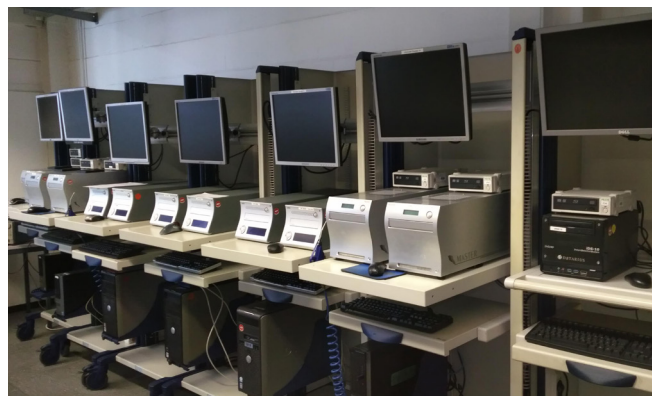
Pos. 285 1 BD Testsystem Tester 6 1 BD testing system Tester 6