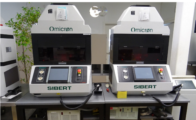
Pos. 101 1 Stanzautomat 1 Automated punching press