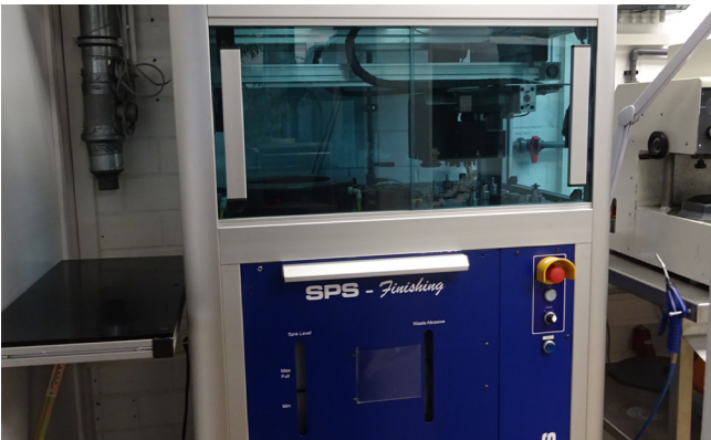
Pos. 100 1 BD-Aussenrandaufraumaschine 1 BD edge roughing device