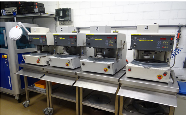
Pos. 99 1 Stamper-Schleifautomat 1 Stamper edger