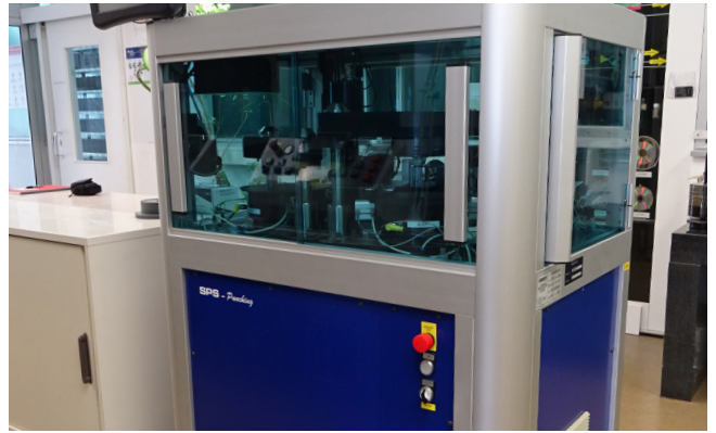
Pos. 105 1 Stanzautomat 1 Automated punching press