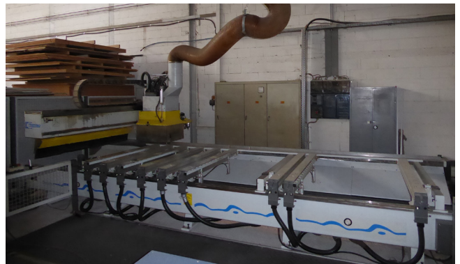
Pos. 37 1 CNC-Bearbeitungszentrum Fabr. Homag, Typ Genius BOF 20/40/16/1/K 1 CNC processing centre Homag, model Genius BOF 20/40/16/1/K