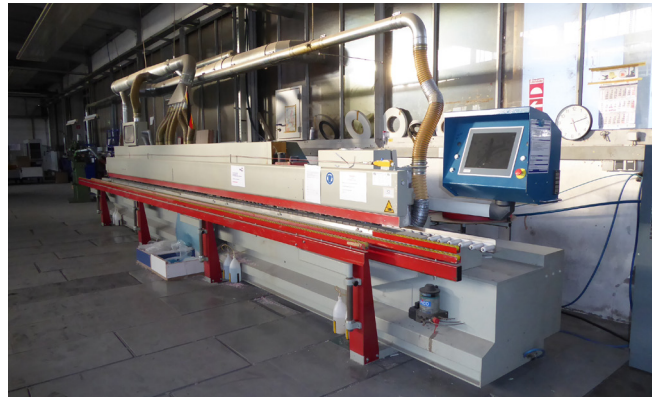
Pos. 32 1 Kanten-Anleimmaschine Fabr. Ott, Typ XM2508-F 1 Edge gluing machine Ott, model XM2508-F