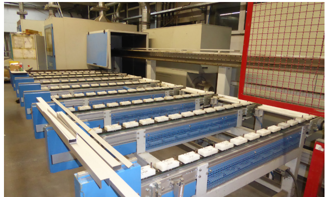
Pos. 139 1 Aluminium-Bearbeitungszentrum Fabr. RWG 1 Aluminium processing centre RWG