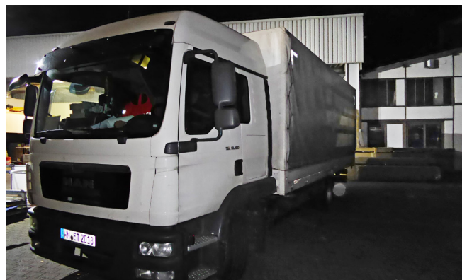
Pos. 227 1 LKW (amtl. Kz.: WN-ET 2018) Fabr. MAN, Typ TGL 8.180 4x2 BL 1 Truck (reg. no.: WN-ET 2018) MAN, model TGL 8.180 4x2 BL