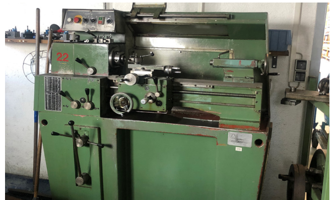
Pos. 6 1 L&Z Drehmaschine TOS SM 16A, Bj. 1978 1 L&Z lathe TOS SM 16A, YOM 1978