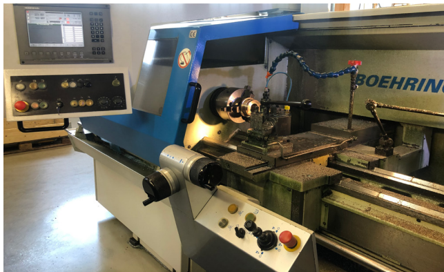
Pos. 2 1 Zyklen-Drehmaschine BOEHRINGER DUS 400 ti, Bj. 2006 1 Cycle lathe BOEHRINGER DUS 400 ti, YOM 2006