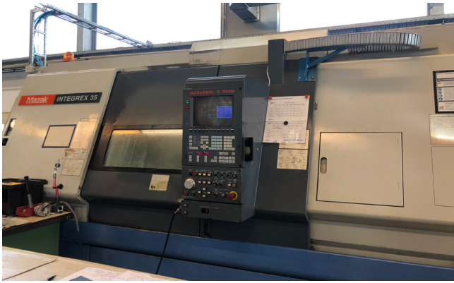
Pos. 1 1 CNC Drehmaschine MAZAK Integrex 35Y, Bj. 1996 1 CNC lathe MAZAK Integrex 35Y, YOM 1996