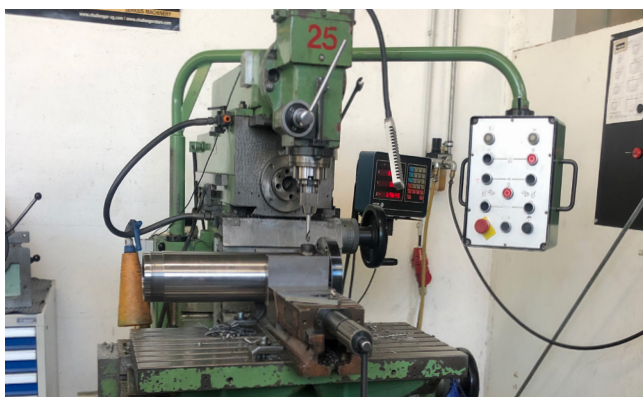
Pos. 4 1 Universal-Bohr- und Fräsmaschine AVIA D36, Bj. 1986 1 Universal drilling and milling machine AVIA D36, YOM 1986