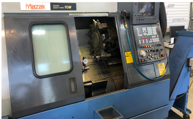
Pos. 3 1 CNC Drehmaschine MAZAK Super Quick Turn 10 M, Bj. 1998 1 CNC lathe MAZAK Super Quick Turn 10 M, YOM 1998