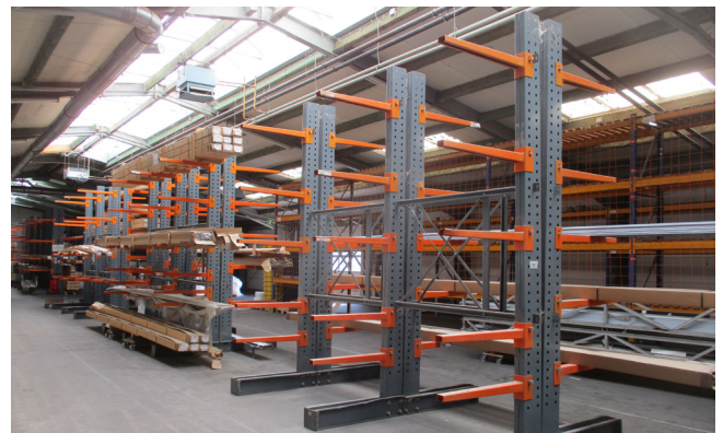
Pos. 57 6 Kragarmregale GALLER HRZ10, Bj. 2003 6 Cantilever racks GALLER HRZ10, YOM 2003