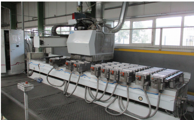
Pos. 48 1 CNC-Bearbeitungszentrum WEEKE BMP 140, Bj. 1999 1 CNC machining center WEEKE BMP 140, YOM 1999