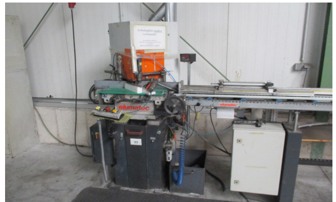
Pos. 53 1 Keil- und Klinkschnittsäge ELUMATEC KS 101/30, Bj. 2002 1 Mitre saw ELUMATEC KS 101/30, YOM 2002