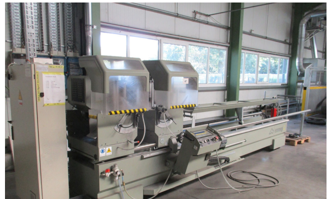
Pos. 47 1 Doppel-Gehrungssäge EMMEGI Classic Magic 500 TU/4, Bj. 2016 1 Double miter saw EMMEGI Classic Magic 500 TU/4, YOM 2016