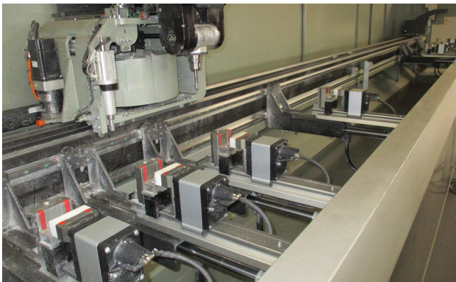
Pos. 46 1 Bearbeitungszentrum EMMEGI Phantomatic X6-HP, Bj. 2017 1 Machining center EMMEGI Phantomatic X6-HP, YOM 2017