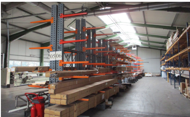
Pos. 56 9 Kragarmregale GALLER HRZ10, Bj. 2003 9 Cantilever racks GALLER HRZ10, YOM 2003