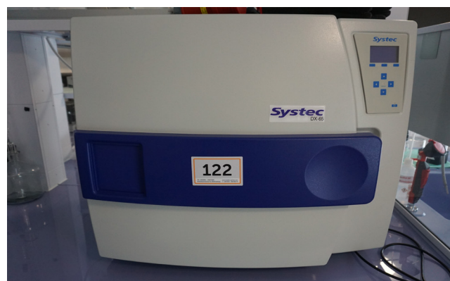
Pos. 122 1 Autoklav SYSTEC DX-65, Bj. 2020 1 Autoclave SYSTEC DX-65, YOM 2020