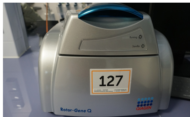
Pos. 127 1 Real-time-Thermocycler QIAGEN Rotor Gene Q, Bj. 2020 1 Real-time thermocycler QIAGEN Rotor Gene Q, YOM 2020