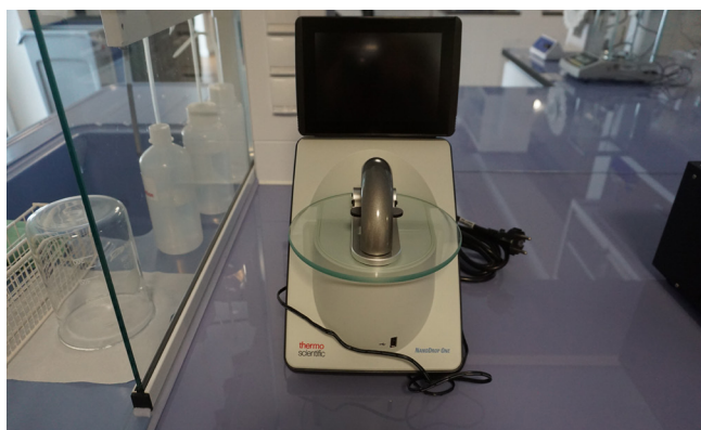
Pos. 104 1 Spectralphotometer THERMO SCIENTIFIC NanoDrop One, Bj. 2020 1 Spectrophotometer THERMO SCIENTIFIC NanoDrop One, YOM 2020