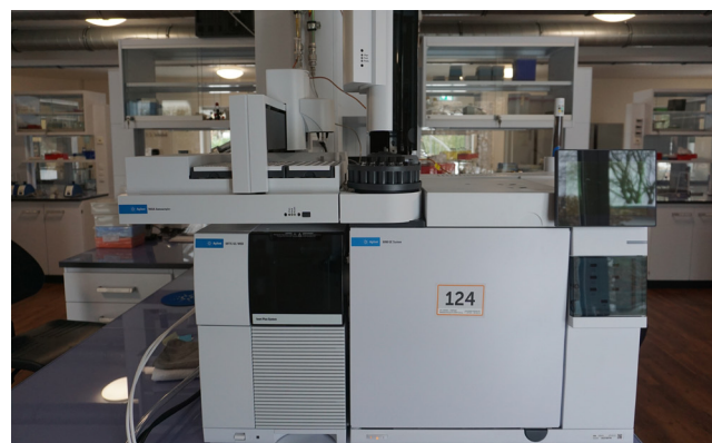
Pos. 124 1 Gas-Chromatograph AGILENT, Bj. 2023 1 Gas chromatograph AGILENT, YOM 2023