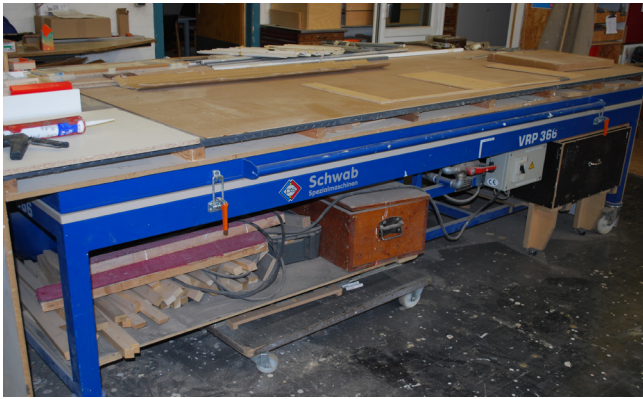
Pos. 52 1 Vakuum-Membranenpresse 1 Vacuum Membrane Press