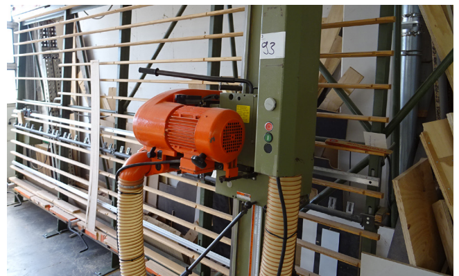
Pos. 93 1 Dicken-Hobel 1 Thick planer