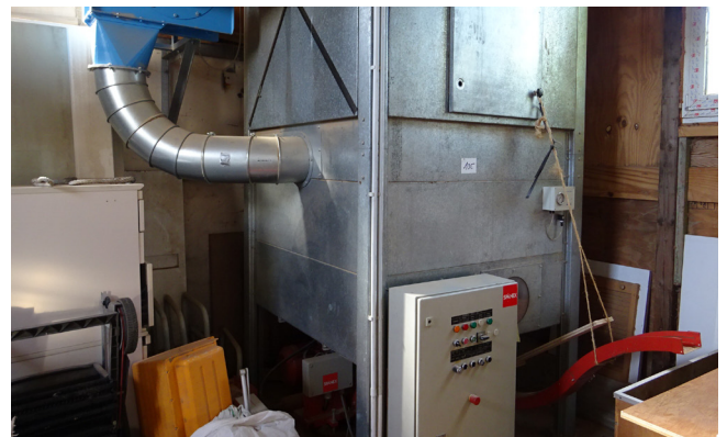
Pos. 105 1 Brikettpresse / Absauganlage 1 Briquette Press/Extraction System