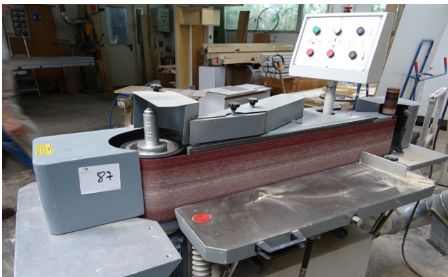
Pos. 87 1 Kanten-Schleifmaschine 1 Edge Grinding Machine