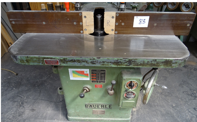
Pos. 83 1 Tischfräse 1 Table Mill