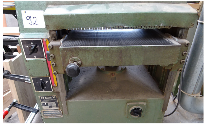
Pos. 92 1 Platten-Aufteil-Säge 1 Panel Division Saw