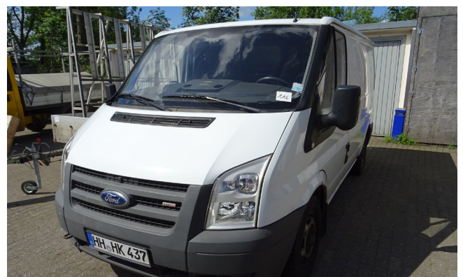
Pos. 116 1 LKW 1 Truck