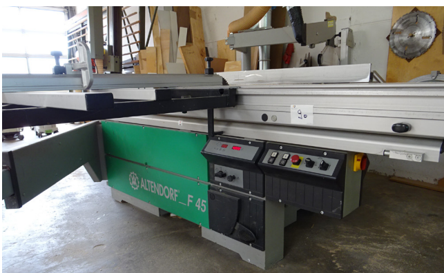
Pos. 90 1 Format-Kreissäge 1 Circular Saw