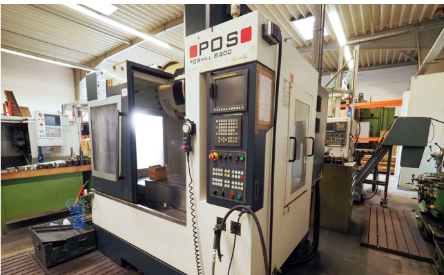
Pos. 113 1 CNC-Bearbeitungszentrum POSMILL B800, Bj. 2014 1 CNC machining center POSMILL B800, YOM 2014