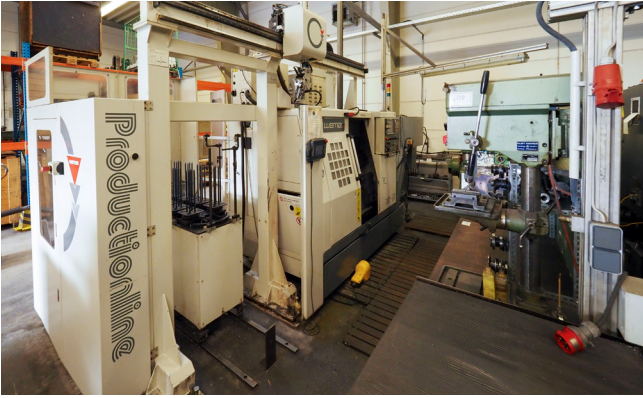
Pos. 106 1 CNC-Drehmaschine WEMAS TURN-210, Bj. 2010 1 CNC lathe WEMAS TURN-210, YOM 2010