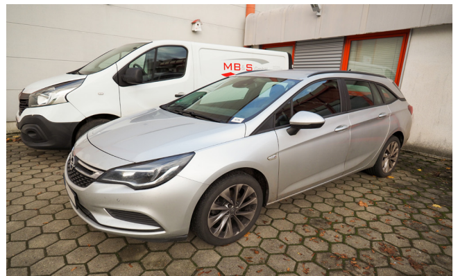
Pos. 216 1 PKW OPEL ASTRA 1.6 CDTI SPORTSTOURER, Diesel, EZ 07/2016 1 Car OPEL ASTRA 1.6 CDTI SPORTSTOURER, Diesel, first reg. 07/2016