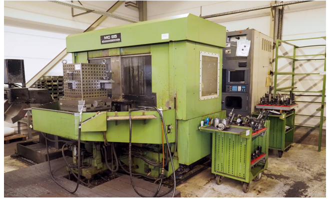
Pos. 122 1 Horizontales Bearbeitungszentrum HEIDENREICH & HARBECK MAKINO 1 Horizontal machining center HEIDENREICH & HARBECK MAKINO MC65, YOM 1990