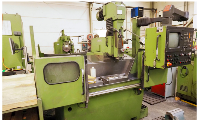
Pos. 131 1 Fräsmaschine RECKERMANN, Bj. 1991 1 Milling machine RECKERMANN, YOM 1991