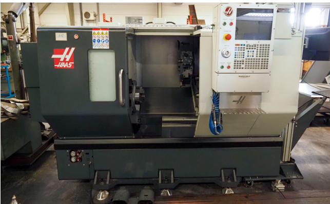
Pos. 112 1 CNC-Drehmaschine HAAS ST-20Y, Bj. 2018 – unter Vorbehalt 1 CNC lathe HAAS ST-20Y, YOM 2018 – subject to prior sale