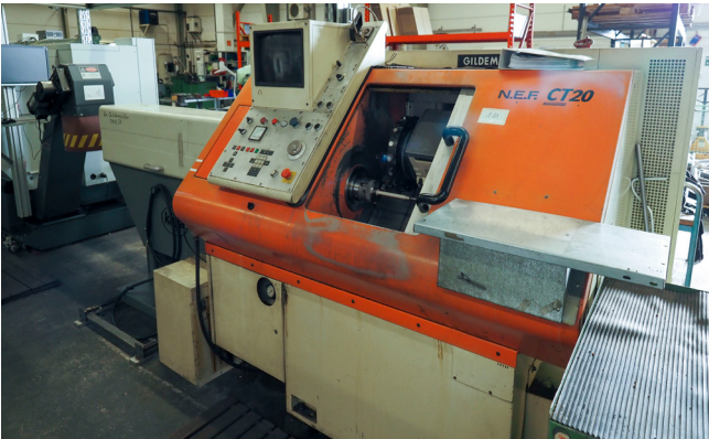
Pos. 110 1 CNC-Drehmaschine GILDEMEISTER NEF CT20 1 CNC lathe GILDEMEISTER NEF CT20