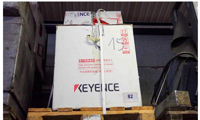
Pos. 82 1 Digitaler Messprojektor KEYENCE XM T1000, Bj. 2017 1 Digital measuring projector KEYENCE XM T1000, YOM 2017