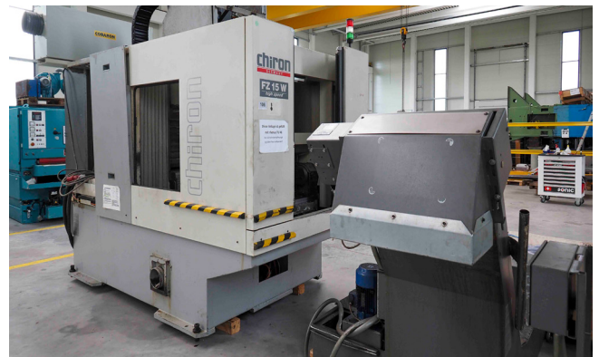
Pos. 106 1 CNC-Bearbeitungszentrum CHIRON FZ15W high speed, Bj. 2001 1 CNC machining center CHIRON FZ15W high speed, YOM 2001