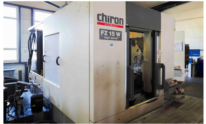
Pos. 20 1 CNC-Bearbeitungszentrum CHIRON FZ15W high speed, Bj. 2001 1 CNC machining center CHIRON FZ15W high speed, YOM 2001