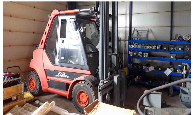
Pos. 68 1 Treibgas-Gabelstapler LINDE H80T-03, Bj. 2004 1 LPG forklift LINDE H80T-03, YOM 2004