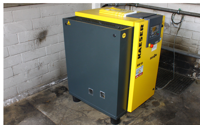
Pos. 208 1 Schraubenkompressor KAE, Bj. 2022 1 Screw compressor KAE, YOM 2022