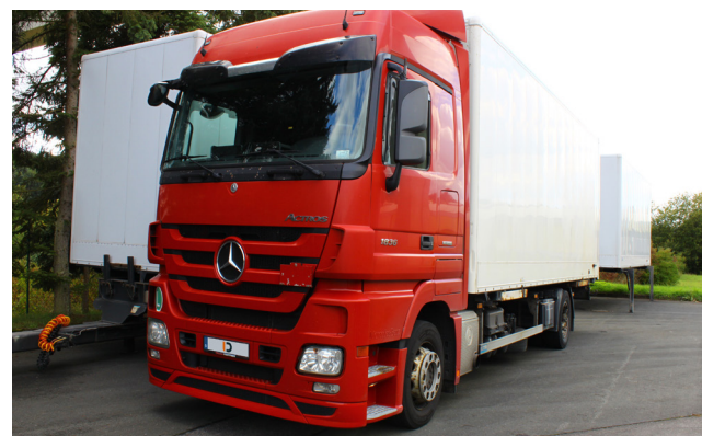
Pos. 210 1 LKW-Wechselbrücken-Fahrzeug MERCEDES BENZ Actros 1836 L 1 Truck swap body vehicle MERCEDES BENZ Actros 1836 L