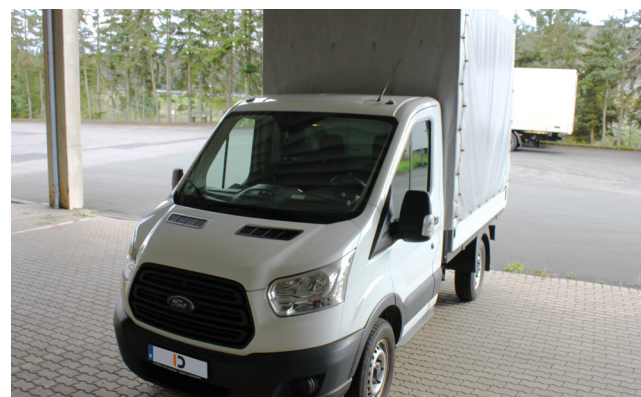
Pos. 211 1 LKW FORD Transit, Diesel, EZ 11/2014 1 Truck FORD Transit, Diesel, initial reg. 11/2014