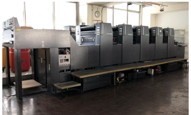
Pos. 591 1 Bogenoffsetmaschine Heidelberg Speedmaster 74-5-H, Bj. 1994 1 Sheetfed offset press Heidelberg Speedmaster 74-5-H, YOM 1994