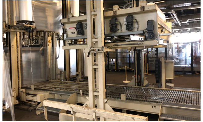
Pos. 583 1 Paletten Verpackungsstrasse Reker, Bj. 2004 1 Pallet packaging line Reker, YOM 2004