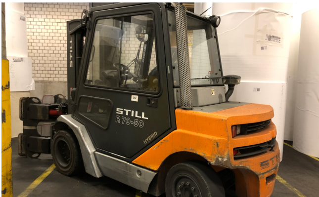
Pos. 342 1 Dieselstapler D41 Still R70-50, Bj. 2010 1 Diesel forklift D41 Still R70-50, YOM 2010