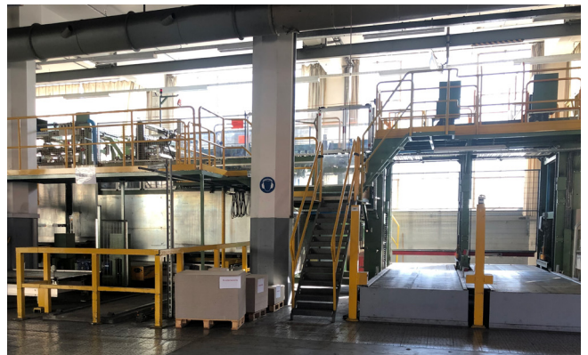
Pos. 587 1 Einriesmaschine ERM6 Wrapmatic GRM, Bj. 2004 1 Ream-packing machine ERM6 Wrapmatic GRM, YOM 2004