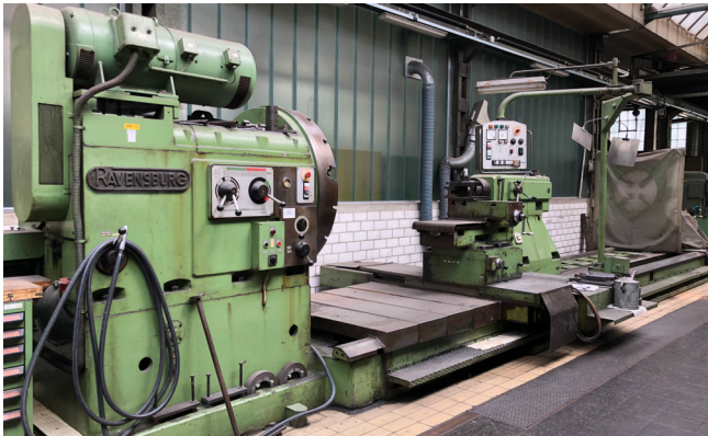
Pos. 82 1 Walzendrehmaschine Ravensburg, Serien-Nr. 8922 1 Roller turning machine Ravensburg, serial no. 8922