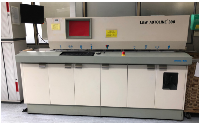
Pos. 552 1 autom. Prüfstraße Lorentzen & Wettre Autoline 300, Bj. 1999 1 Automatic test line Lorentzen & Wettre Autoline 300, YOM 1999