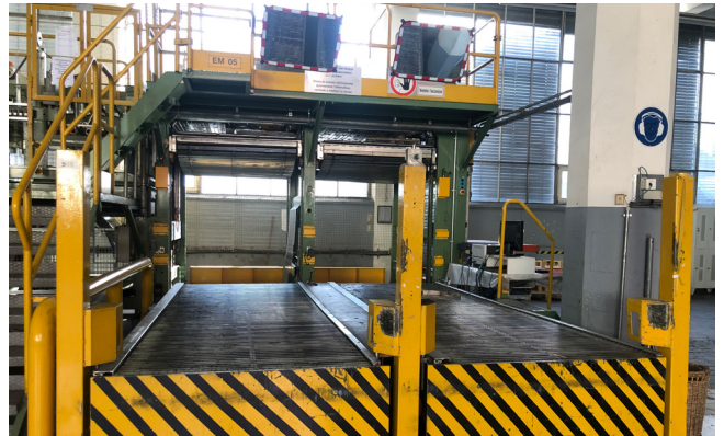
Pos. 586 1 Einriesmaschine ERM5 Wrapmatic GRM 1 Ream-packing machine ERM5 Wrapmatic GRM