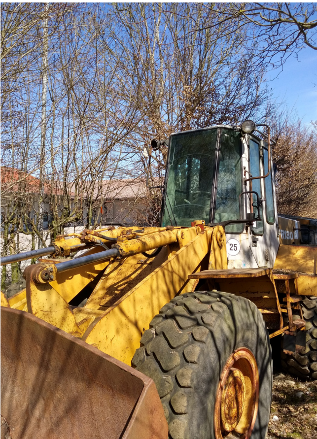
Pos. 52 1 Radlader 1 Wheel loader