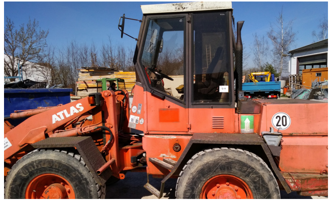
Pos. 79 1 Radlader 1 Wheel loader