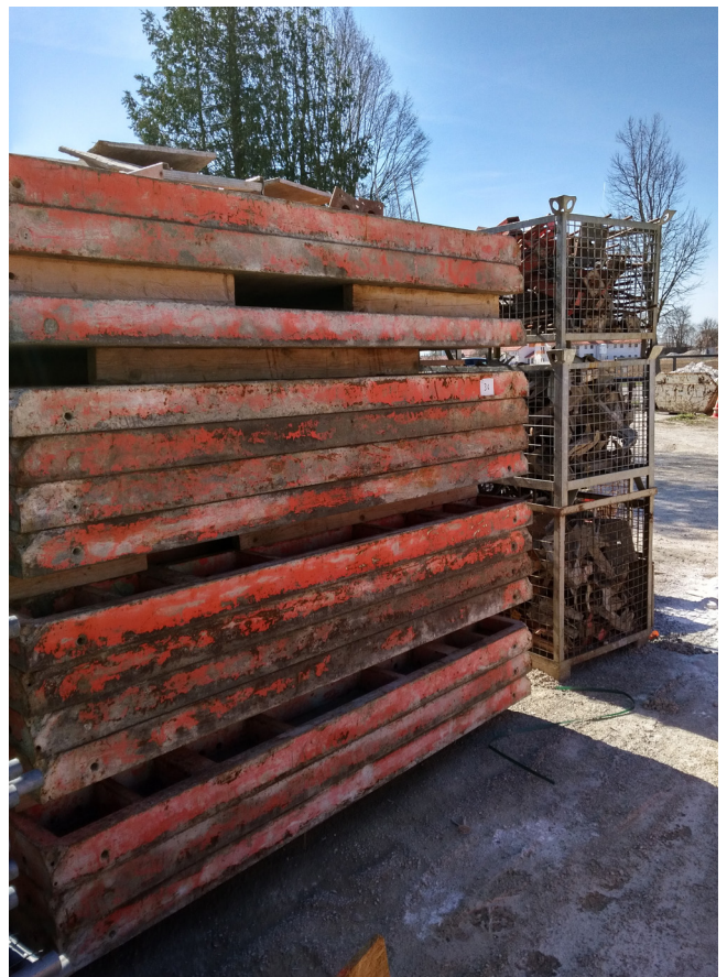
Pos. 36 1 Posten Peri Schalung Assorted PERI formwork