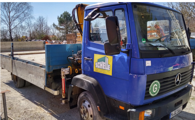
Pos. 73 1 LKW 1 Truck