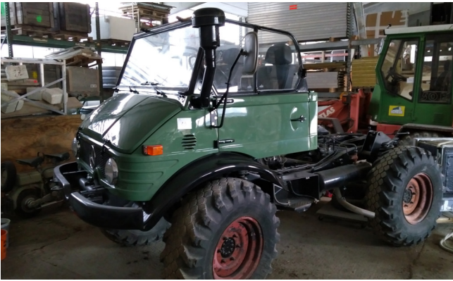
Pos. 86 1 Unimog Cabriolet 1 Unimog convertible