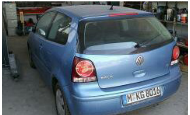
Pos. 84 1 PKW 1 Car