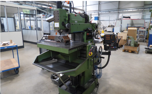
Pos. 474 1 Universalfräsmaschine DECKEL FP4M, Bj. 1989 1 Universal milling machine DECKEL FP4M, YOM 1989