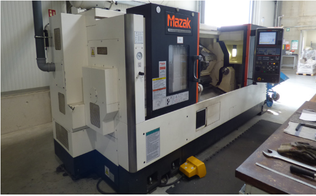
Pos. 417 1 CNC-Drehmaschine MAZAK Quickturn Nexus 250-IIMY, Bj. 2015 1 CNC lathe MAZAK Quickturn Nexus 250-IIMY, YOM 2015