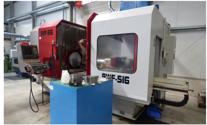
Pos. 491 1 CNC-Innen-Planschleifmaschine BWF SI 6/1 AS-N X710 1 CNC internal surface grinding machine BWF SI 6/1 AS-N X710