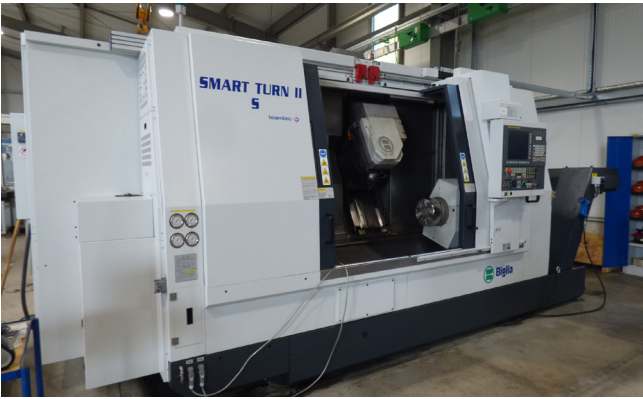
Pos. 456 1 CNC-Dreh- und Fräszentrum BIGLIA Smart Turn II-S, Bj. 2021 1 CNC turning and milling centre BIGLIA Smart Turn II-S, YOM 2021