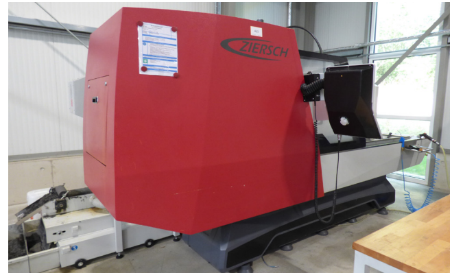
Pos. 489 1 CNC-Flachschleifmaschine ZIERSCH Z48, Bj. 2022 1 CNC surface grinding machine ZIERSCH Z48, YOM 2022