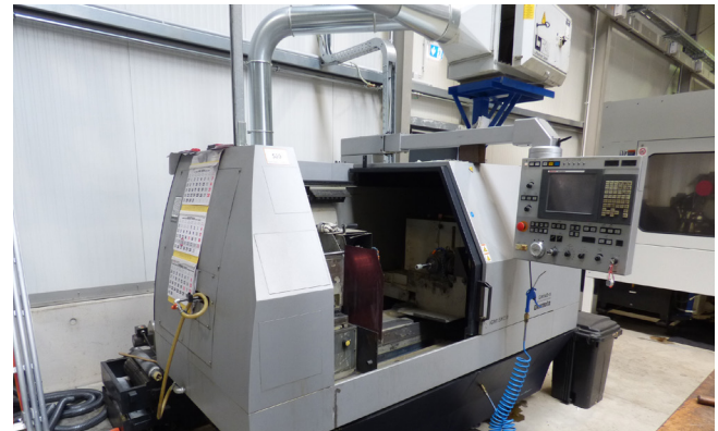
Pos. 520 1 CNC-Innenschleifmaschine OKAMOTO IGM15NC III, Bj. 2012 1 CNC internal grinding machine OKAMOTO IGM15NC III, YOM 2012