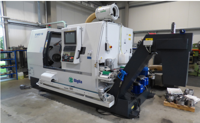
Pos. 450 1 CNC-Drehmaschine BIGLIA B 620 YS, Bj. 2021 1 CNC lathe BIGLIA B 620 YS, YOM 2021