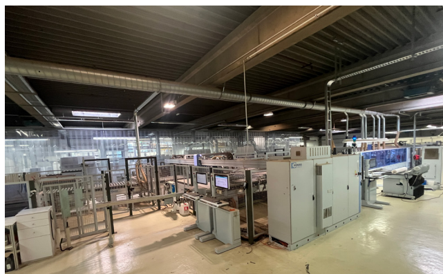
Pos. 144 1 Kantenbearbeitungsanlage HOMAG KAR 370/10/A3/WZ/L Profiliene 1 Edge processing facility HOMAG KAR 370/10/A3/WZ/L Profiline, YOM 2016