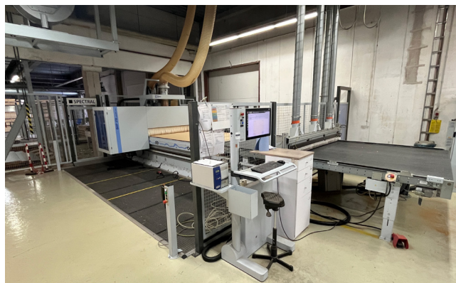
Pos. 148 1 CNC-Bearbeitungszentrum WEEKE Profi BHP210/31/22/R, Bj. 2016 1 CNC processing center WEEKE Profi BHP210/31/22/R, YOM 2016