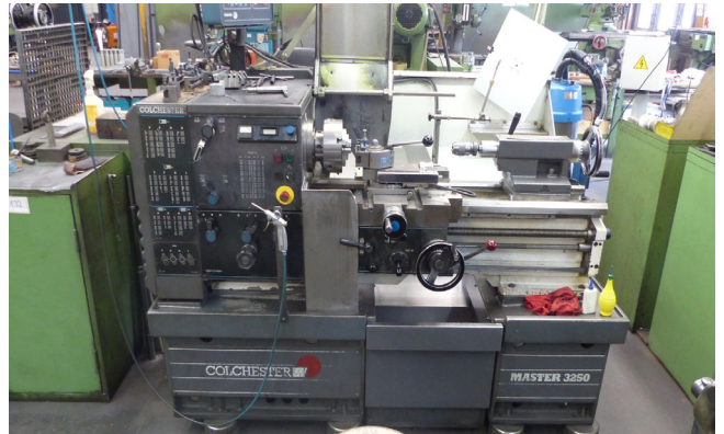
Pos. 133 1 Leit- und Zugspindeldrehmaschine COLCHESTER MASTER 3250 1 Center lathe COLCHESTER MASTER 3250