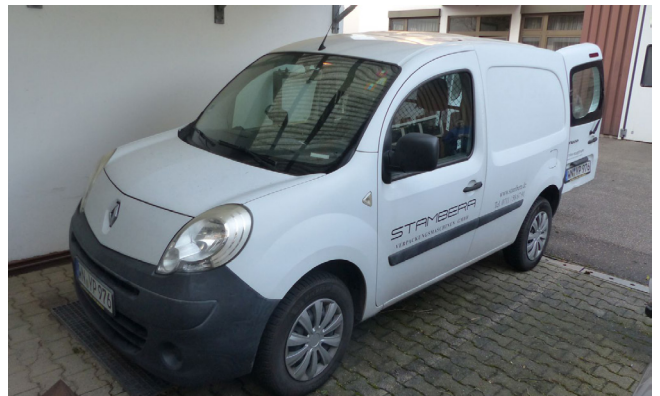
Pos. 278 1 PKW RENAULT KANGOO RAPID 1.5 DCI, Diesel 1 Car RENAULT KANGOO RAPID 1.5 DCI, Diesel