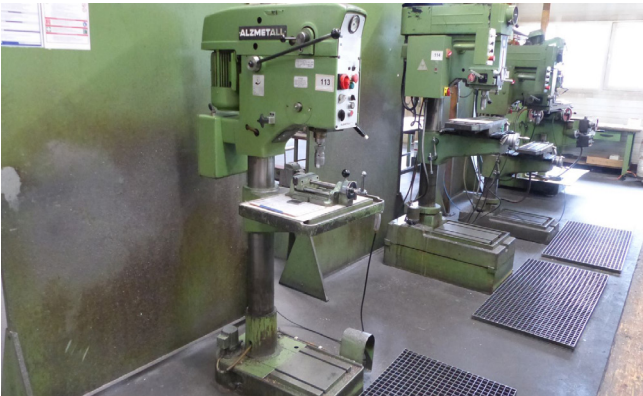
Pos. 113 1 Säulenbohrmaschine ALZMETALL AB35S, Bj. 1987 1 Column drill ALZMETALL AB35S, YOM 1987