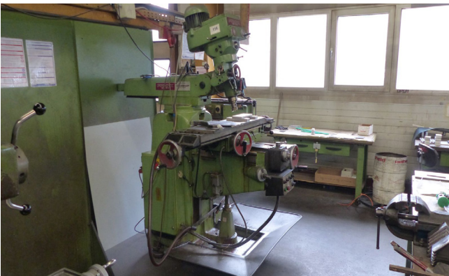
Pos. 116 1 Fräsmaschine PANAK FV 4 1 Milling Machine PANAK FV 4