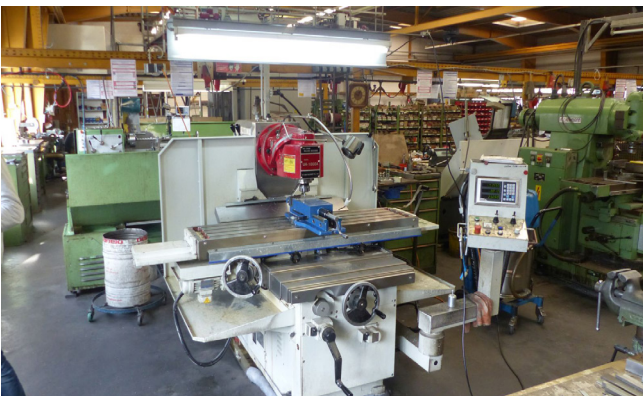
Pos. 123 1 Bettfräsmaschine HO CHUN MACHINERY UH-1000A, Bj. 2014 1 Flatbed milling machine HO CHUN MACHINERY UH-1000A, YOM 2014