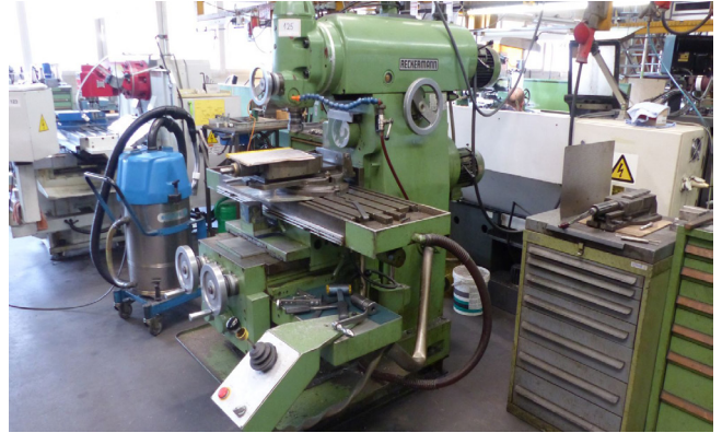
Pos. 125 1 Konsol-Fräsmaschine RECKERMANN KOMBI 900, Bj. 1983 1 Cantilever-type milling machine RECKERMANN KOMBI 900, YOM 1983