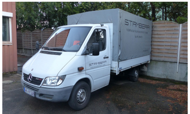
Pos. 279 1 LKW MERCEDES BENZ 313 CDI, Diesel 1 Truck MERCEDES BENZ 313 CDI, Diesel