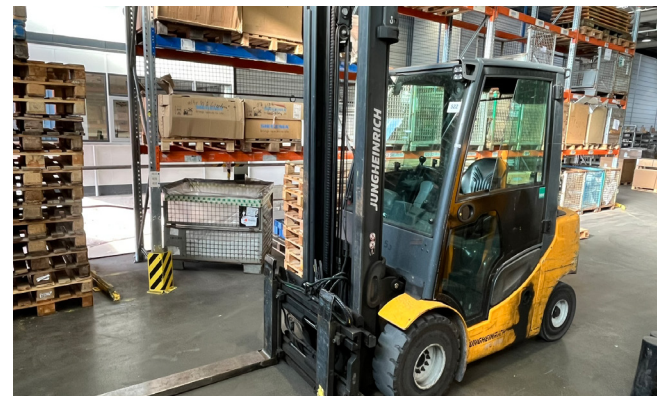
Pos. 522 1 Diesel-Gabelstapler JUNGHEINRICH DFG 430s G-400ZT, Bj. 2015 1 Diesel forklift JUNGHEINRICH DFG 430s G-400ZT, YOM 2015