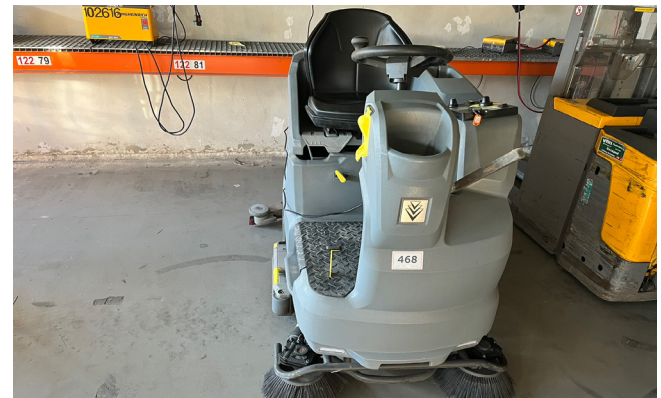
Pos. 468 1 Aufsitz- Scheuer-/ Saugmaschine KÄRCHER Professional B150R, Bj. 2021 Ride-on scrubbing/suction machine KÄRCHER Professional B150R, YOM 2021