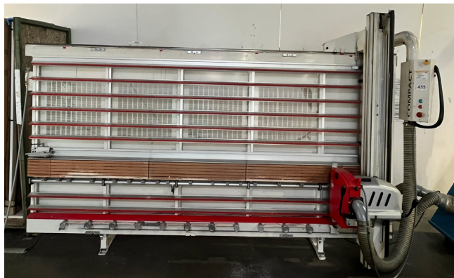
Pos. 435 1 Plattenaufteilsäge STRIEBIG Plattensäge Kompakt, Typ 4164, Bj. 2009 1 Panel saw STRIEBIG Plattensäge Kompakt, Typ 4164, YOM 2009