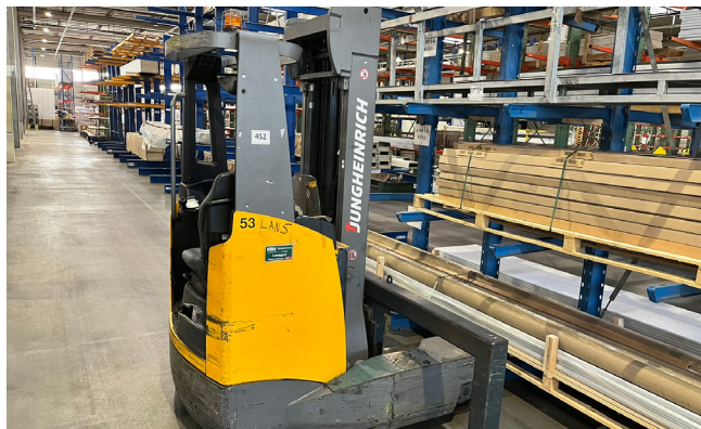
Pos. 452 1 Elektro-Schubmaststapler JUNGHEINRICH ETV Q 20, Bj. 2015 1 Electric reach truck JUNGHEINRICH ETV Q 20, YOM 2015