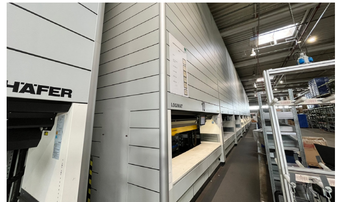
Pos. 473 1 Lagerlift SSI SCHÄFER Lagerlift Logimat (SLL), Bj. 2016 1 Storage lift SSI SCHÄFER Lagerlift Logimat (SLL), YOM 2016